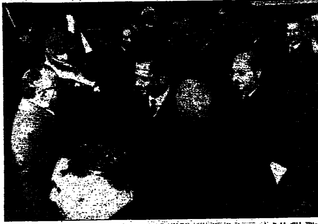
جلالة الملك المعظم لدى وصوله المطار حين ظهر امس غدا بزمالة الله من القاهرة يحيط به الوزراء وكبار رجال الدولة

الاجتماع قبل السفر وقد بعثت الصحافة العربية اهتماما بملقا بالزيارات التي يقوم بها جلالته الحسين والوجود الخاصة التي يبذلها في سبيل وحدة الصف العربي والخروج بآمة الشرق الاوسط الى ما يبعد للبريد فخيم وتقبل انصار للدوران الاصيل على آمة العربية .